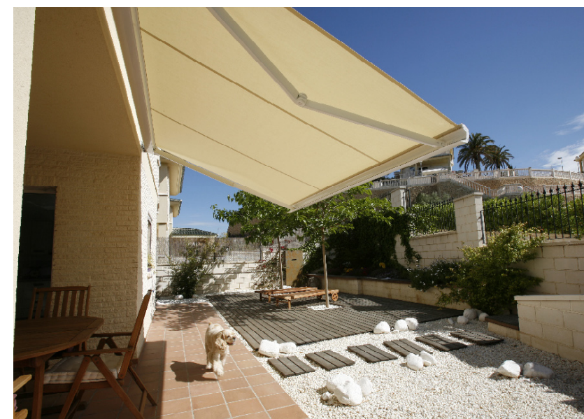
Designul monobloc, cu casetă, este principalul avantaj al copertinelor Athena. Atunci când copertinele sunt pliate, materialul textil și brațele metalice sunt închise într-o casetă, fiind protejate de intemperii. L 300 x l 200 cm • 4.632 lei (versiunea cu automatizare completă, echipată cu senzori de vânt/soare; fără montaj) • MCA Grup

4 Dacă preferi o amenajare tip „all-seasons”, va trebui să optezi pentru o structură închisă, cel mai adesea cu pereți din sticlă. Va avea alura unei extensii a casei, sub forma unei verande, iar utilizarea masivă a sticlei (la pereți și acoperiș) atrage din partea specialiștilor denumirile de „seră de iarnă” sau „grădină de iarnă”. Confortul termic este asigurat indiferent de anotimp, iar spațiile vitrate extinse (și implicit lumina naturală abundentă) ne dau senzația că suntem pe o terasă chiar și în toiu iernii. Fiind o anexă a clădirii, ai nevoie de o autorizație de construcție, iar la alegerea stilului, armonizarea cu tiparul arhitectonic al casei e un criteriu de bază. Foile din sticlă (neapărat cât mai groase și cu bune calități antifracție) sunt fixate într-o structură cu profile din aluminiu (deseori dublată la interior cu elemente din lemn, pentru a conferi ambientului un aer primitiv). O ventilație impecabilă a interiorului (naturală și, eventual, mecanică) e esențială pentru a nu avea condens, una dintre principalele probleme cu care se confruntă uneori serele de iarnă. ■