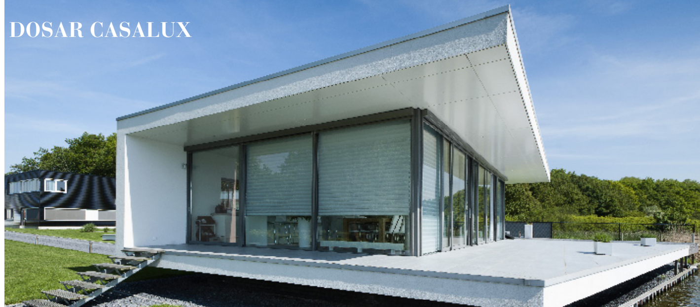
Terasă cu pereți vitrați, realizată cu ferestre glisante minimale (Minimal Windows). Acestea se încadrează foarte discret în corpul clădirii (cadru de glisare inserat în pardoseală) și pot fi acționate electric foarte comod (chiar și la suprafețe extinse, când canaturile au greutate foarte mari). Dimensiuni variate • De la 4.400 lei (geam dublu izolant); de la 5.720 lei (geam triplu izolant) • Cystar Glass