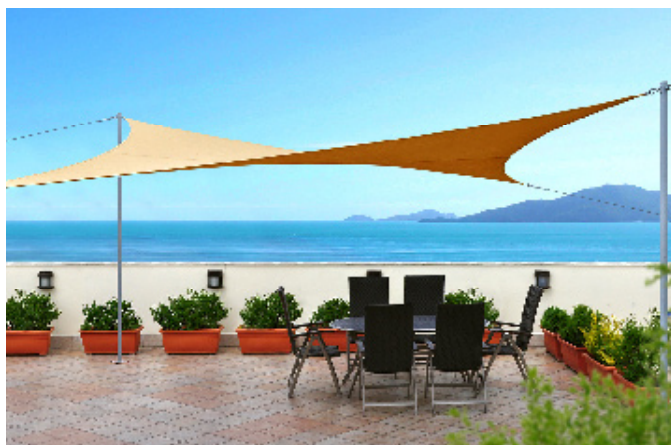
Sunt durabile și nu produc efect de seră (grad de protecție UV de 95%). Prelatele solare au un design special și sunt disponibile în mai multe forme/culori. Dimensiuni variate • De la 235 lei (modele mici) la 800 lei (acoperă suprafețe de cca 36 mp) • www.prelatesolare.ro