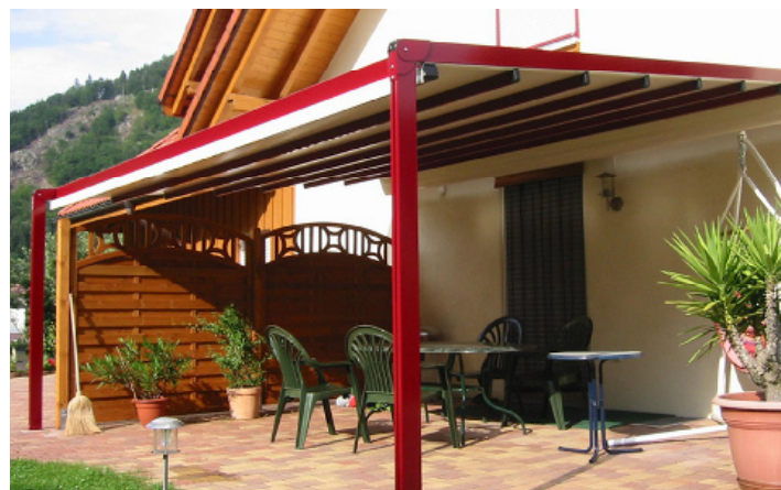
Realizată în întregime din aluminiu și oțel inoxidabil , pergola Alutecnic 1 poate fi încadrată în diverse contexte arhitecturale și e extrem de practică (intervenții de întreținere reduse la minimum). Dimensiuni variate (maximum 1.300 x 550 cm) • De la 183 lei/mp • Casa Roma