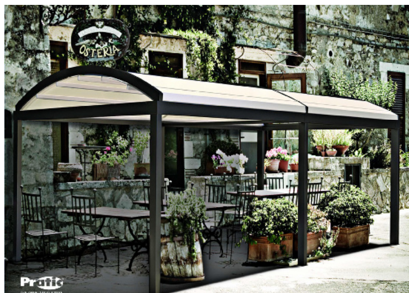
Forma stilată este dată de profilele curbate, din aluminiu, ale acoperișului. Pergola Sky are alura unui pavilion și este ideală pentru acoperirea spațiilor extinse. Opțional, poate fi completată cu pereți laterali, pentru un plus de protecție. Dimensiuni variate (maximum 1.200 x 600 cm) • De la 319 lei/mp • Casa Roma

3 Pergolele presupun o structură de sprijin, cu stâlpi și cadru-suport pentru învelitoare. Aceasta poate fi realizată dintr-un material textil extins (care se pliază), din benzi de material textil sau din lamele din alte materiale (aluminiu, material plastic). Sunt soluția disponibilă pentru umbrirea unor suprafețe extinse sau când nu e posibilă fixarea copertinelor (de exemplu, la piscinele situate chiar lângă peretele casei sau insular în curte). Structurile modulare permit acoperirea oricăror suprafețe, indiferent de mărime sau configurație. Cel mai des, structurile de susținere sunt realizate din profile de aluminiu, dar poți opta și pentru stâlpi/cadre din lemn masiv. Majoritatea modelelor au o ușoară înclinare a acoperișului (pentru scurgerea apei) și există în variante cu acționare manuală sau motorizată (prin apăsarea unui buton, părțile acoperișului se retrag într-o casetă). La cele mai noi modele, sistemele electrice sunt completate de senzori de lumină, ploaie și vânt, care vor acționa automat acoperișul la schimbarea condițiilor meteo.