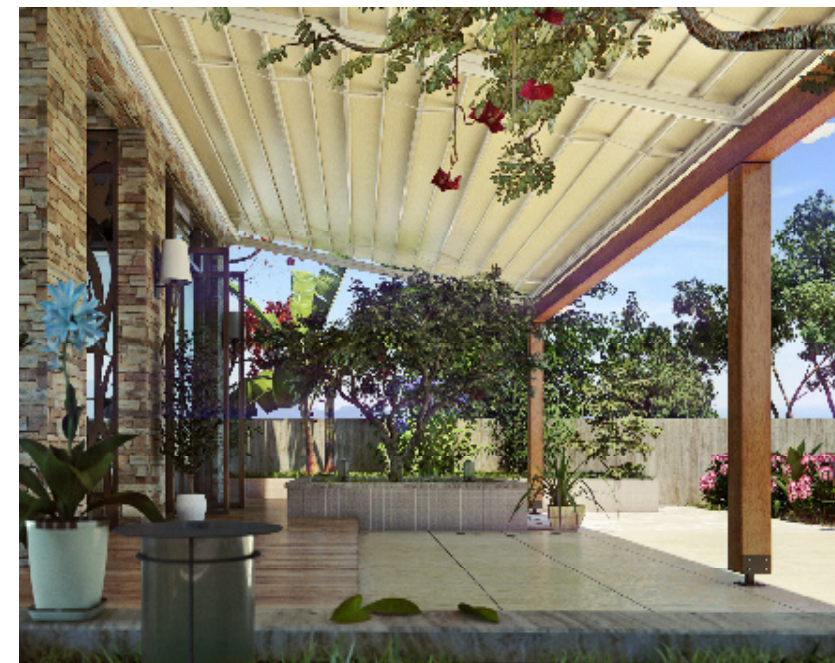
Pentru o terasă generoasă, ai nevoie de o pergolă cu un cadru solid de susținere , ce poate fi din metal (aluminiu) sau lemn. Pergola Magna are un acoperiș retractabil realizat din panouri de PVC, care glisează pe două rame laterale (mod de acționare automat de la distanță). L 500 x l 300 cm • 24.000 lei • Eurotenda Paradise